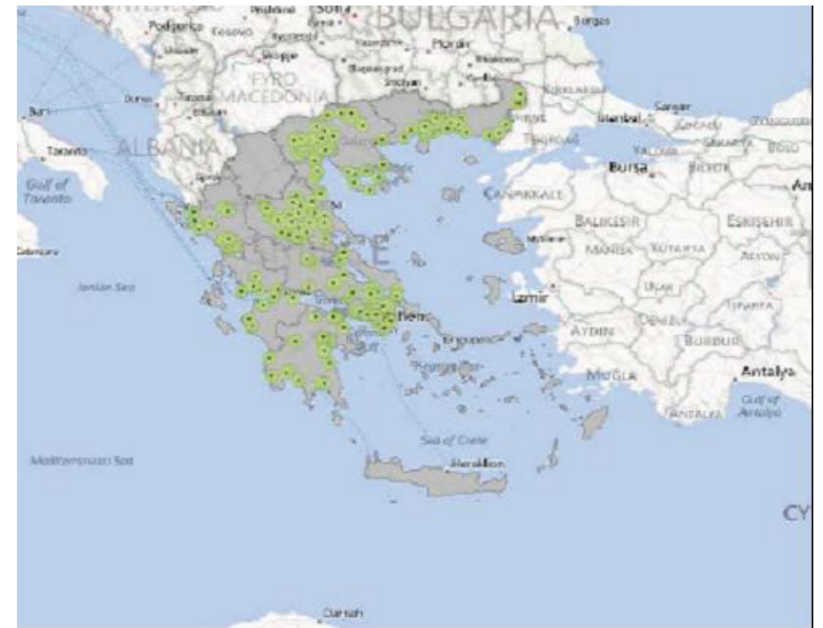
Εικόνα 1: Σταθμοί σύλληψης ακμιαίων κουνουπιών, Εντομολογική Επιτήρηση ΚΕΕΛΠΝΟ 2012