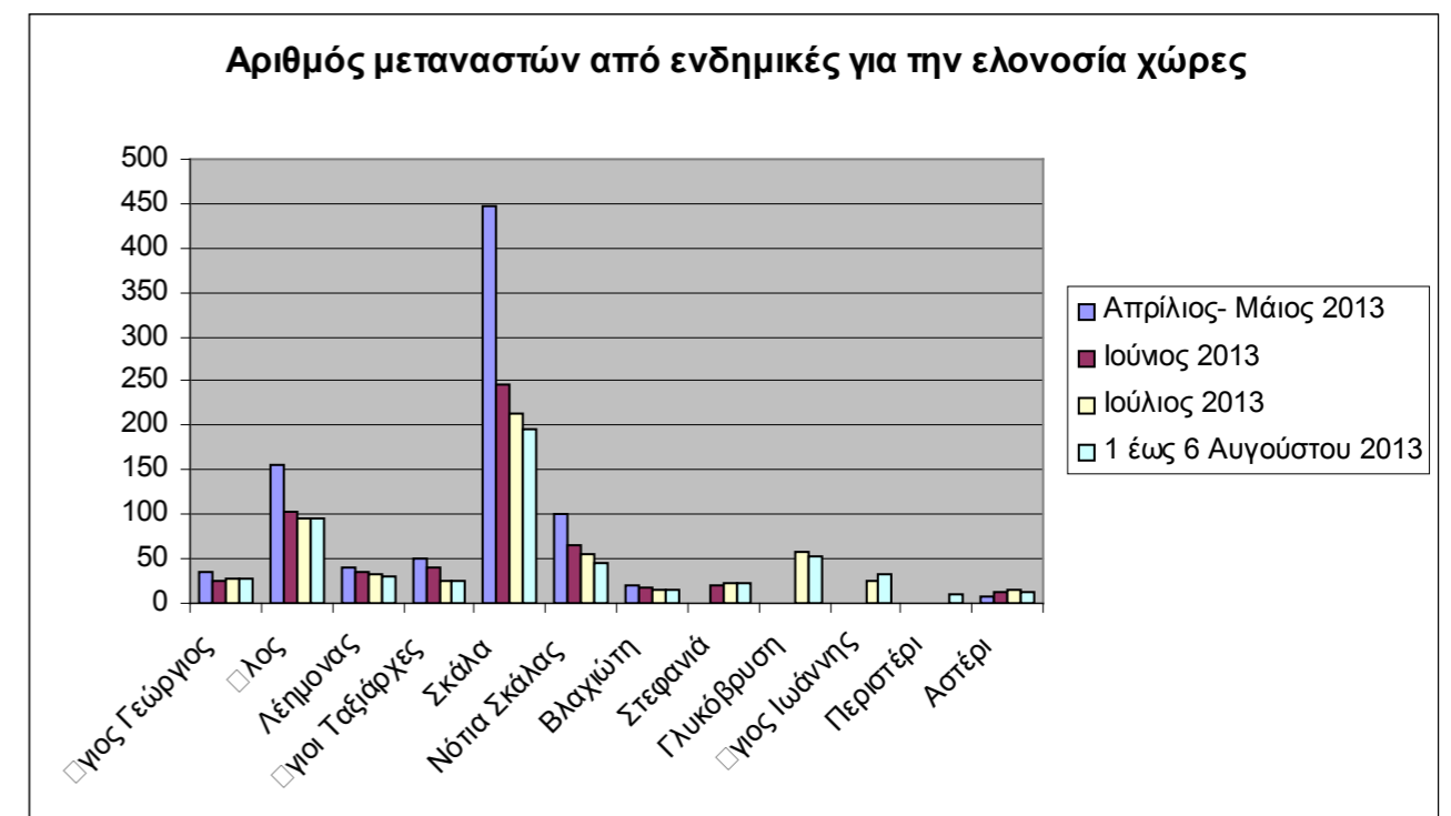
Γράφημα 1: Αριθμός μεταναστών από ενδημικές για την ελονοσία χώρες ανά περιοχή και χρονική περίοδο

Από τις 1 έως και 31 Ιουλίου 2013 έγινε εξέταση για ελονοσία σε 49 ύποπτα περιστατικά, η οποία απέβη σε όλα αρνητική.